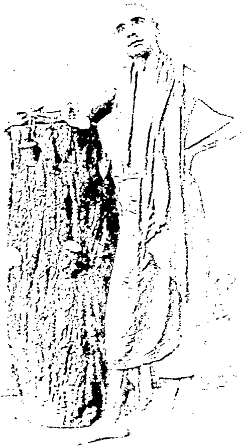
परमहंस स्वामी रामतीर्थ